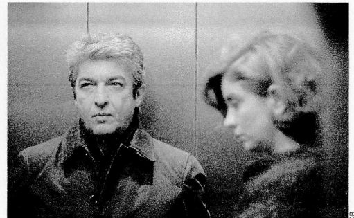
« El presidente ».

GGR, 21 Nord, route d'Alençon Burn Out : 11 h 15, 15 h 45, 18 h, 20 h, 22 h 15. Downsizing : 11 h, 13 h 45, 16 h 30, 19 h 30, 22 h 15. Garde alternée : 11 h 15, 13 h 30, 15 h 45, 18 h. Insidieux : la dernière clé : 13 h 30, 20 h, 22 h 15. Jumanji : bienvenue dans la jungle : 11 h, 13 h 30, 16 h 15 ; 3D : 13 h 45, 19 h 45, 22 h 15. Le corsaire : 19 h 30. Le Crime de l'Orient-Express : 20 h, 22 h 15. Le grand jeu : 11 h, 13 h 45, 22 h 15. Les heures sombres : 11 h, 13 h 45, 16 h 30, 19 h 45. Momo : 11 h 15, 13 h 30, 15 h 45, 18 h, 20 h. Normandie nue : 11 h 15, 13 h 30, 15 h 45, 18 h, 20 h, 22 h 15. Pitch perfect 3 : 22 h 15. Santa & C° : 13 h 30, 15 h 45, 18 h. Star wars - Les derniers Jedi : 11 h, 13 h 30, 16 h 30, 19 h 30, 21 h ; 3D : 10 h 45, 16 h 31, 18 h, 22 h 15. Tout là-haut : 11 h 15, 20 h. Wonder : 11 h, 13 h 30, 15 h 45, 17 h 45, 22 h 15.