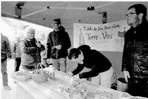
Terre & vins, en passe de devenir l'événement majeur des animations 2018.

Un Salon des vins bio aura lieu à la fin du mois d'avril